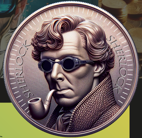
Token SHMC Tecnología Ettios

Bienvenido al mundo de Sherlock Holmes Meme Coin (SHMC), una criptomoneda única inspirada en el legendario detective Sherlock Holmes. Nuestro objetivo es combinar la fascinación por Sherlock Holmes con la tecnología blockchain para crear una comunidad activa y comprometida.