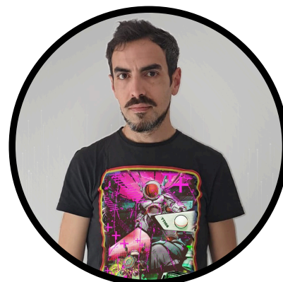
Ezequiel Romagnano Graphic Design - MKT